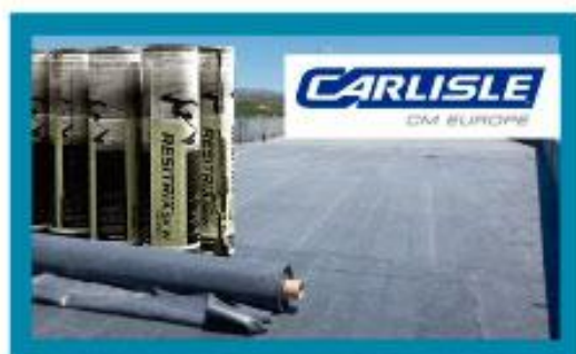
impermeabilización EPDM transitable

Socy ofrece una amplia gama de membranas y accesorios. Todo ello forma parte de los sistemas completos de impermeabilización EPDM.