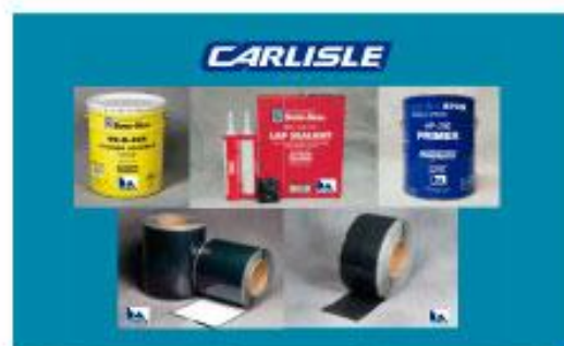
Adhesivos, sellantes y accesorios