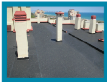
El Saler (Valencia)

EPDM Transitable con loseta de caucho reciclado (solo 5Kg. de peso)