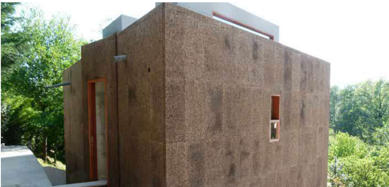
The Cork House – Arq.º Anibal Remo Cunha

con el fin de mejorar su resistencia mecánica, y la respectiva reducción de la absorción de agua. Sus características le permiten un excelente rendimiento incluso bajo las condiciones climáticas más adversas.